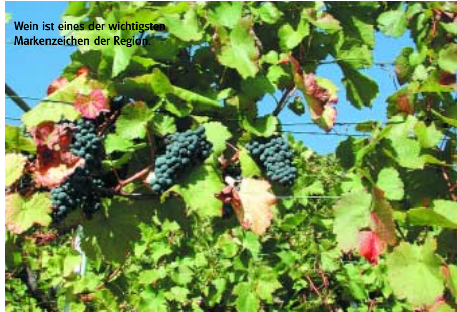
Wein ist eines der wichtigsten Markenzeichen der Region.

Auf den unterschiedlichen Böden der Region wachsen Weine heran, die sich in Qualität und Vielfalt mit den besten Deutschlands messen können.