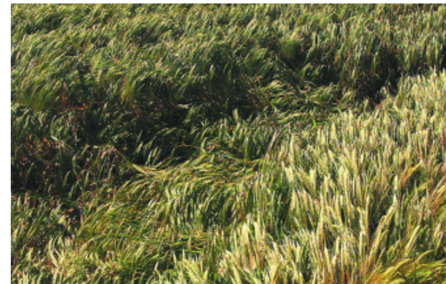
Die Bauern in der Region ernteten in diesem Jahr rund ein Viertel weniger Getreide. Nun hoffen die am stärksten betroffenen Betriebe auf Ausgleichszahlungen.

Im Main-Tauber-Kreis schätzt Ries die Ausfälle bei der Braugerste auf bis zu 30 Prozent, beim Dinkel im Raum Boxberg sind es bis zu 15 Prozent. Beim Mais könnte sich bei weiterer Trockenheit der Ertrag halbieren. Hohe Rapsverluste