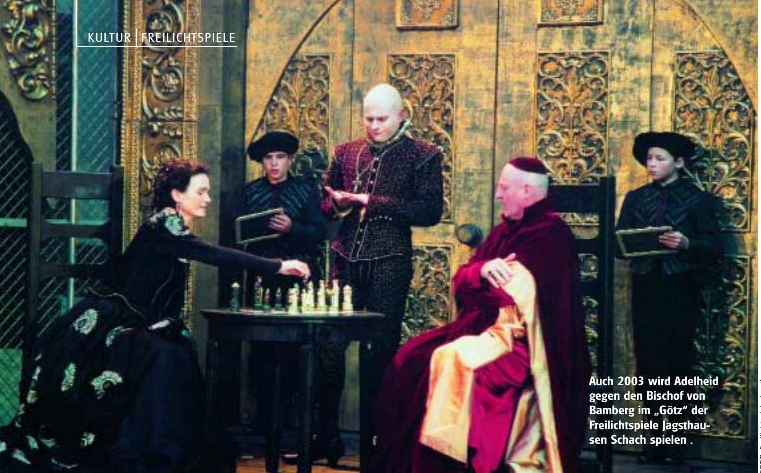
Auch 2003 wird Adelheid gegen den Bischof von Bamberg im „Götz“ der Freilichtspiele Jagsthausen Schach spielen .