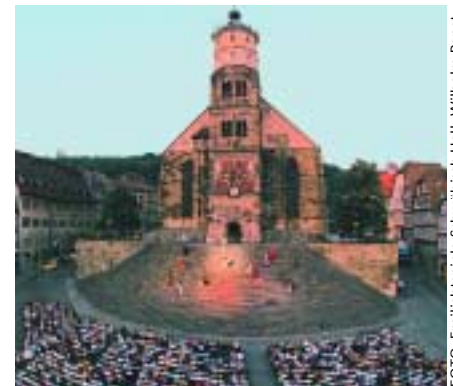
Schwäbisch Halls Große Treppe ist 2003 die Bühne für „Der Name der Rose“, „Wilhelm Tell“ und das „Schwarzwaldmädel“.

Ganz anders, aber nicht minder reizvoll ist die Situation in Schwäbisch Hall. Hier lockt die einzigartige Kulisse auf dem Marktplatz vor den Stufen der Michaelskirche. Hinzu kommt, dass die Freilichtspiele ihr Kulturprogramm und ihre Spielstätten stetig ausgeweitet haben und so neues Publikum für sich gewinnen konnten. Die Konkurrenz innerhalb der Region ist fruchtbar: Macht eine Stadt mit neuen Sparten, guten Schauspielern oder Trendstücken Furore, muss die andere nachziehen, ein spannendes Wechselspiel entsteht.