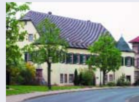
Auch in Ahorn wird Ende des Jahres ein neuer Bürgermeister gewählt.

Der Termin für die Europa- und Kommunalwahl wurde bewusst auf den 13. Juni zusammengelegt, um Anreize für eine höhere Wahlbeteiligung zu geben. zim