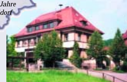
... und in Oberrot gewählt.