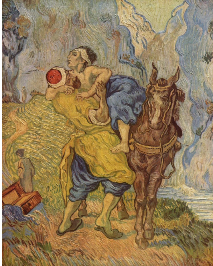
Vincent van Gogh – Der barmherzige Samariter