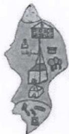
Teil des Main-Tauber-Kreis-Puzzles aus Lauda.