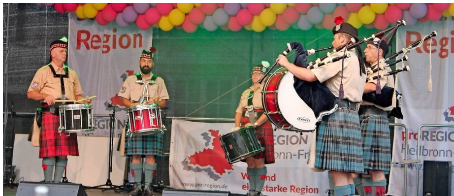
Mit Dudelsack und Trommeln: Die Hohenlohe Highlanders Pipes and Drums treten beim Regionaltag auf.

Der 22. Regionaltag der Bürgerinitiative pro Region findet am 13. Juli in Heilbronn statt. Die Veranstaltung soll den Besuchern die Vielfalt Heilbronn-Frankens näher bringen und dazu beitragen,