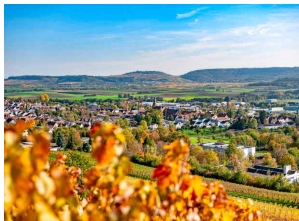
Güglingen ist am kommenden Sonntag zum ersten Mal Gastgeber für den Regionaltag. Auf die Besucher der Zabergäustadt, die auch für ihren Wein bekannt ist, wartet ein vielfältiges Programm mit Information, jeder Menge kulturellen Angeboten und kulinarischen Genüssen.