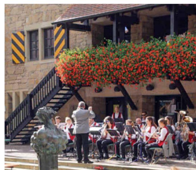
Nach dem Festvortrag marschieren die Güglinger Musiker vom Rathaus zum Deutschen Hof, wo sie auf der Bühne ein Konzert geben.

und an der Kirche. Jugendzentrum Güglingen Gewinnspiel: Beim jährlichen Preiswettbewerb der Bürgerinitiative winken als Hauptpreis ein Übernachtungsgutschein für eine Familie im Baumhaus mit Tagespässen für den Erlebnispark Tripsdrill sowie viele weitere tolle Preise. Das Preisrätsel sowie weitere Informationen unter dem Stichpunkt Regionaltag auf www.pro-region.de. Mitmachen lohnt sich.