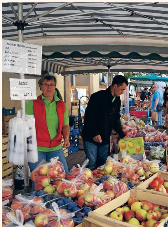
Gutes aus der Region