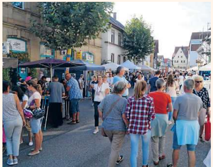
Der Regionaltag in Güglingen ist ein Besuchermagnet

Kaffee und Kuchen servieren die Landfrauen Güglingen