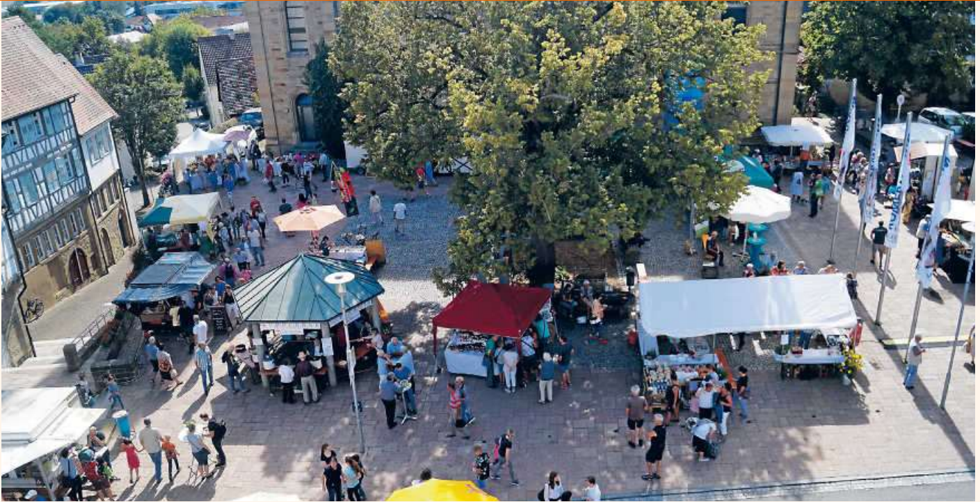
Viele Anbieter sind mit dabei