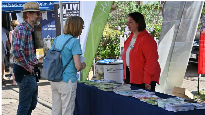
Mit einem Infostand wird die Stadt Lauda-Königshofen auf dem Regionaltag der Region Heilbronn-Franken in Bad Rappenau für die touristischen Angebote der Stadt werben.

Von Pressemitteilung 09.07.25, 11:03 Uhr